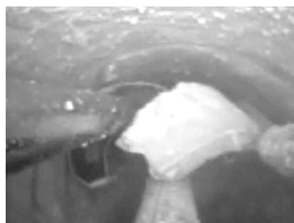
Fig.2. Picture of a solid air around 5 K.