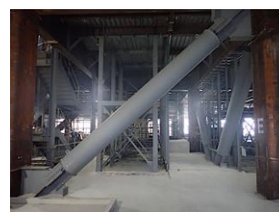
開発ダンパーの取付状況