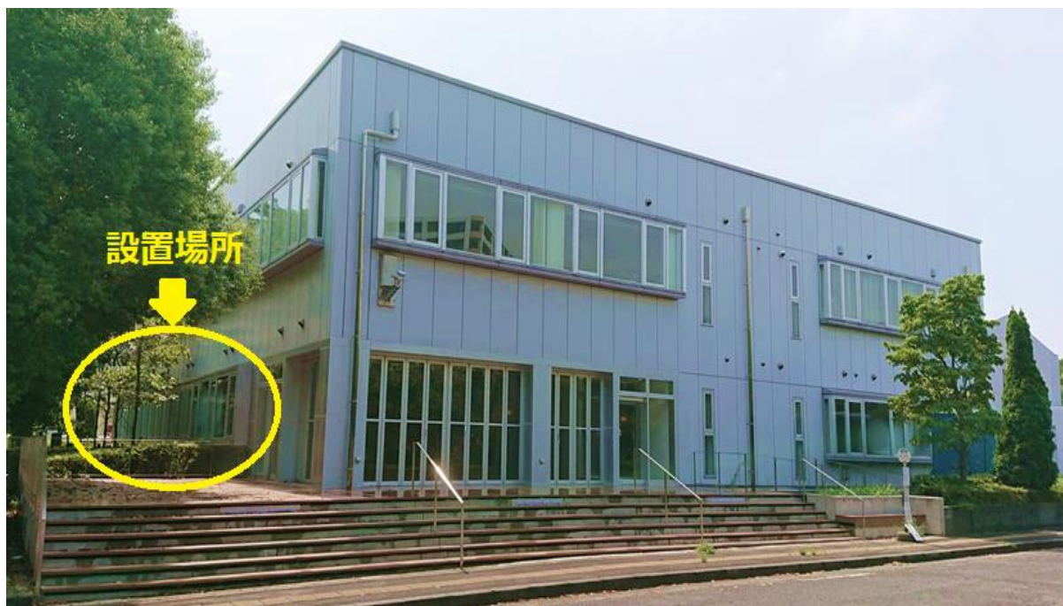
図2 つくばスタートアップパークにおける調光ガラスの設置場所

今回、ベンチャー企業の育成や市内の研究機関の保有技術の実用化を積極的に推進しているつくば市の支援を受けて、つくばスタートアップパーク（茨城県つくば市吾妻 2-5-1）（図2）の窓に、青色と紫色のメタロ超分子ポリマー（図3、図4）を用いて作製したエレクトロクロミック調光ガラスを設置し、長期使用における動作安定性を確認するための実証実験を9月8日より開始します。また、実証実験期間を通じて、施設利用者からのアンケート結果などを参考に、操作性を含めたデバイス全体の改良を行っていく予定です。一方、実証実験中の本 EC 調光ガラス窓をショーケースとみなし、市内外の製造企業に積極的に本技術を紹介することで、将来の実用化に向けたサプライチェーンの構築を目指します。なお、本調光ガラスは既存の窓の内側に後付けで設置しており、実証実験後は EC 調光ガラスを取り外して、原状復帰することが可能です。