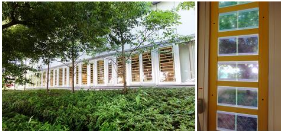
図1 調光ガラスを設置する施設の窓 (左) と取り付けが済んだ調光ガラス (右)

3. 今回、ベンチャー企業育成や市内研究機関が持つ技術の実用化を推進するつくば市の支援を受けて、青色と紫色の EC 調光ガラスをつくばスタートアップパーク (茨城県つくば市吾妻 2-5-1) の窓に設置し、長期使用に対する動作安定性に関する実証実験を9月8日より開始します。1,000 枚以上の調光ガラス (1 枚 10cm × 10cm) を、木枠に入れて既存の窓の内側に設置します。また、2021 年3月までの本実証実験期間を通じて、施設利用者にも操作していただき、要望に沿って切り替えの操作性などを改良する予定です。