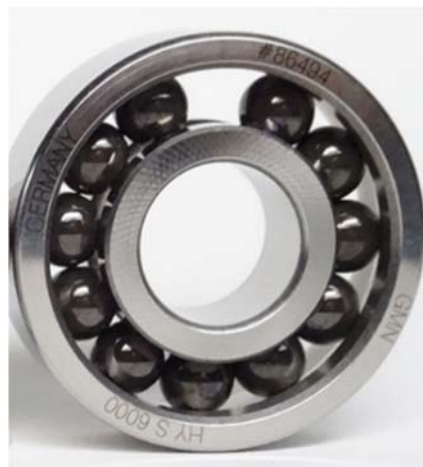
図2 ZnO コーティングを施したベアリングボールを組み込んだベアリング