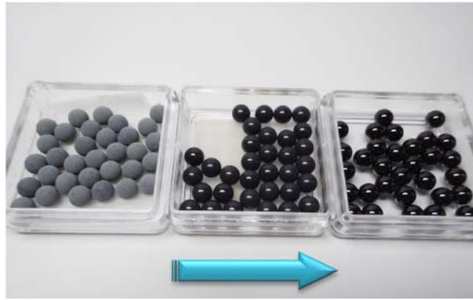
図1 ZnO コーティングを施したベアリングボール (左から右へ良質な ZnO コーティングへと進化している)