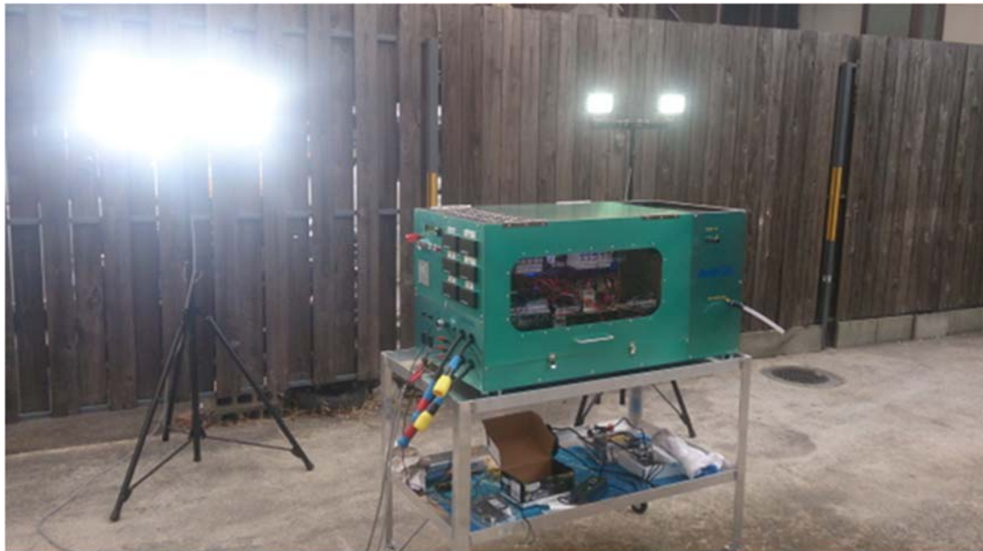
図5 ZnO コーティングベアリングを搭載した災害用小型ジェットエンジン発電機 (当該発電機で発電した電力でライトを点灯している様子)