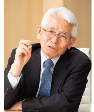
トンネル磁気抵抗素子における室温巨大磁気抵抗の実現とそのスピントロニクスデバイス応用に関する先導的研究