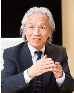
異方性焼結ネオジム磁石の発明と実用化