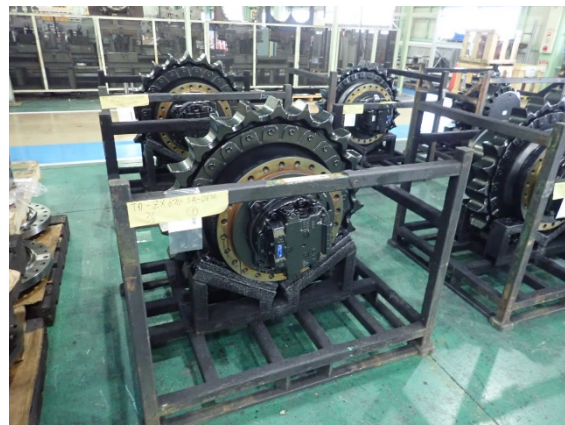
歯車が組み込まれている巡回減速機(左)と走行減速機(右)

本手法は、日立建機の土浦工場と常陸那珂工場において、2021 年 1 月より試験的に導入を開始しており、2021 年度中に本格的な導入を予定しています。将来的には、再生事業を行っている日立建機グループの海外拠点への導入も計画しています。日立建機と NIMS は、これからも共同開発を継続し、再生部品のデータベースと AI を組み合わせて、より高精度かつ迅速に歯車の再利用可否を判定する手法の開発をめざします。