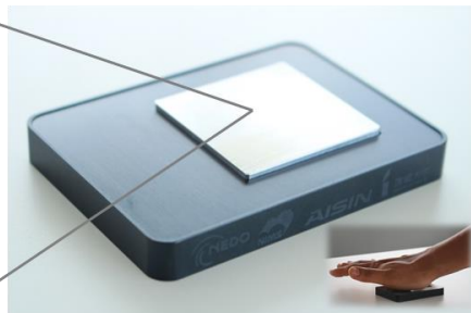
図2 IoT機器の試作機(温度・湿度センサー・BLE通信機器を内蔵した温度差駆動の自立電源システム)と、データ受信状況