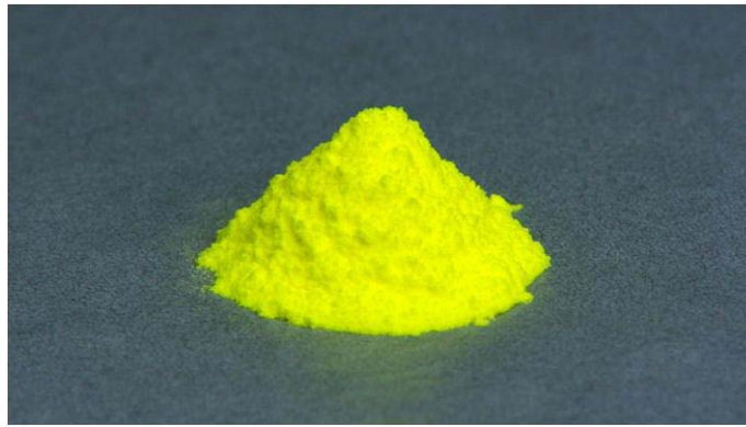
図3: YAG 単結晶パウダー