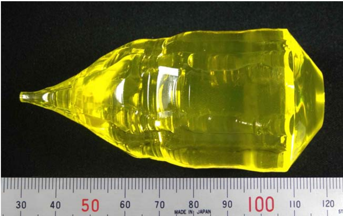
図 1: YAG 単結晶蛍光体インゴット