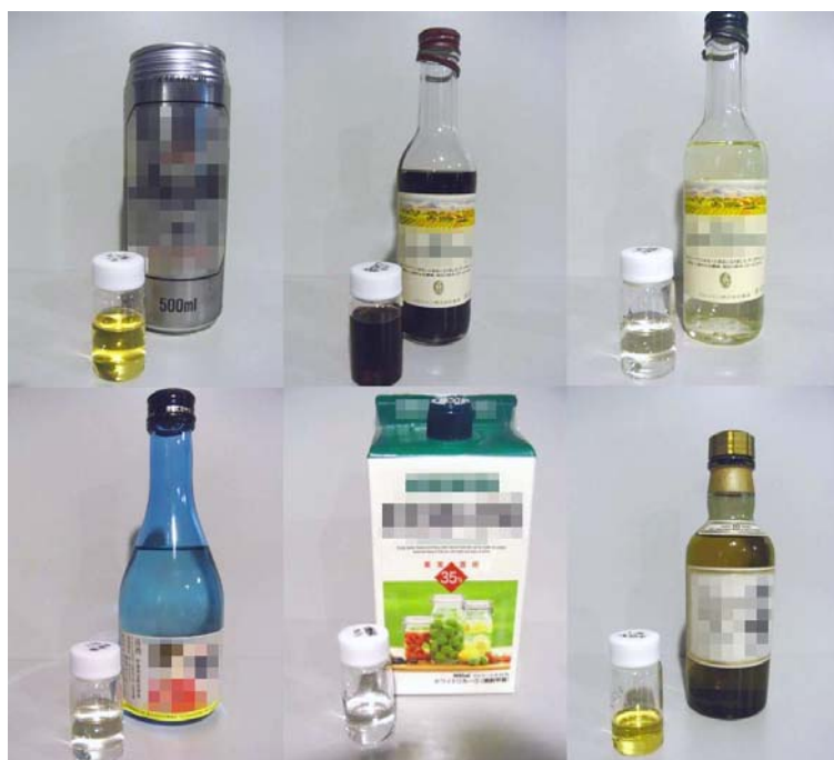
図3 実験に用いた酒（ビール、赤ワイン、白ワイン、日本酒、焼酎、ウイスキー）と試料の写真