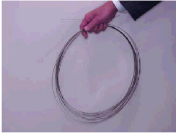
写真1 二硼（ホウ）化マグネシウム系超伝導線の外観