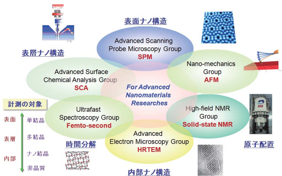
図1 表面・表面層・固体内部にいたるトップレベル高度ナノ計測基盤技術の開発

ナノ物質・材料研究とは、新規なナノ物質を創製し、極微構造に起因する機能を探索することにより、有用な機能を有する材料を開発することである。本プロジェクトではナノ物質・材料研究にとって必要不可欠な情報であり、かつ高度なレベルに達している計測技術（走査型プローブ顕微鏡（SPM）、透過電子顕微鏡（TEM）、表面化学分析、フェムト秒レーザー分光、核磁気共鳴分光（NMR）、超高分解能原子間力顕微鏡（AFM））をサブテーマとして設定する。固有の計測技術の連携により包括的なナノ物質・材料解析技術の確立を目指すものである。