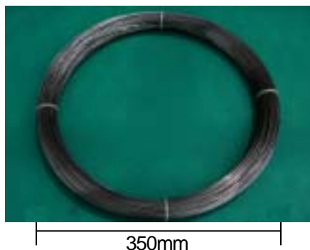
図 1 線径 1.3mm の超鉄鋼コイル

図 1 に数 km 長さのコイルから切り出した、線径 1.3mm の超微細粒鋼線材の外観写真を示します。