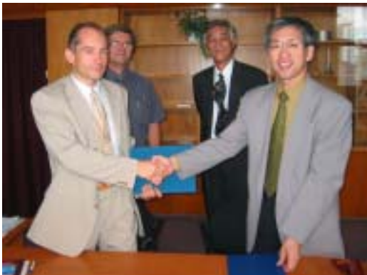
(前列左から、署名後の Klamo VUZ 所長と長井超鉄鋼研究センター長、後列左から、Mraz 溶接試験研究部長と平岡溶接グループアソシエートディレクター)