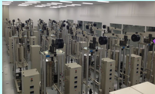
NIMS先進構造材料研究棟 大型クリープ試験機群

NIMS大型溶接継手試験片を調査対象に、 民間企業の非破壊検査、組織調査等の技術 を結集し、余寿命診断データベース構築