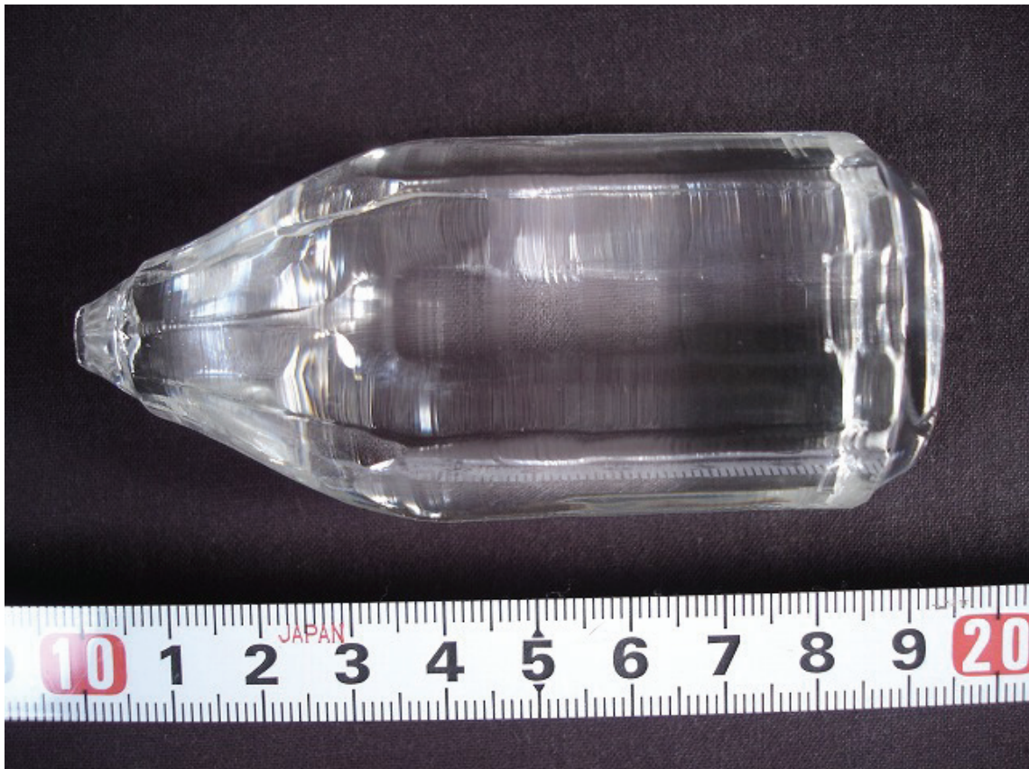
図1 フッ素 (F) ドープ・コアフリーYAG 単結晶。